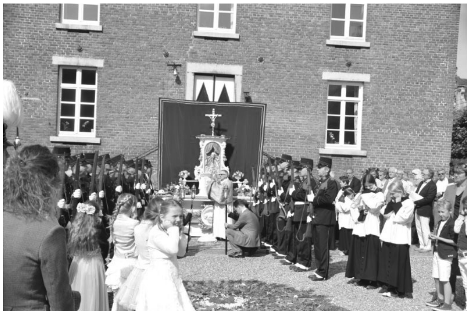
Processie naar Cartils 2014

Wilt u zorgen dat uw auto zondagmorgen vanaf 7.00 uur elders geparkeerd is dan langs de processieroute? Alvast heel erg bedankt voor uw medewerking. En uiteraard is iedereen van harte uitgenodigd mee te lopen in onze processie waarmee al eeuwenlang uiting wordt gegeven aan ons geloof en een traditie in ere wordt gehouden die diep geworteld is in onze Limburgse cultuur.